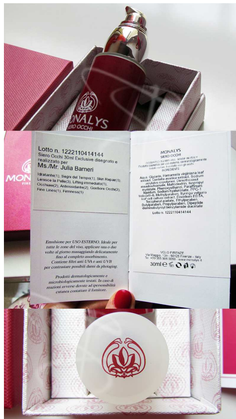
Monalys, da Mono , unico, e Lys , il giglio.