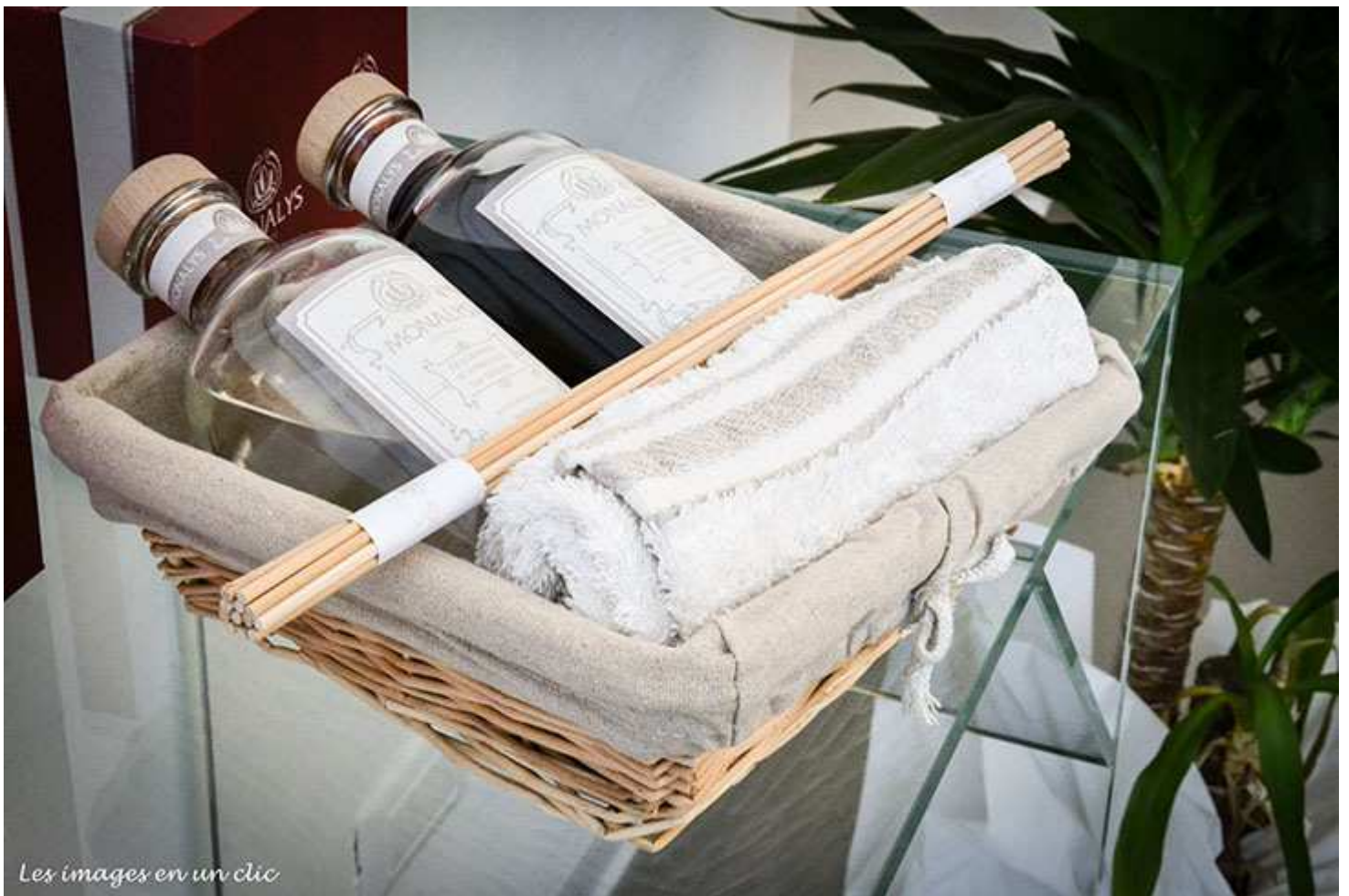
Les images en un clic

L'Atelier Monalys riprende quella che è la tradizione cosmetica fiorentina e ne introduce una cosmesi su misura con l'opportunità di rivoluzionare il modo in cui ci prendiamo cura di noi stessi.